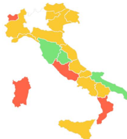
Persone con 2 o più patologie croniche (comorbidità) per regione di residenza Passi 2022-2023